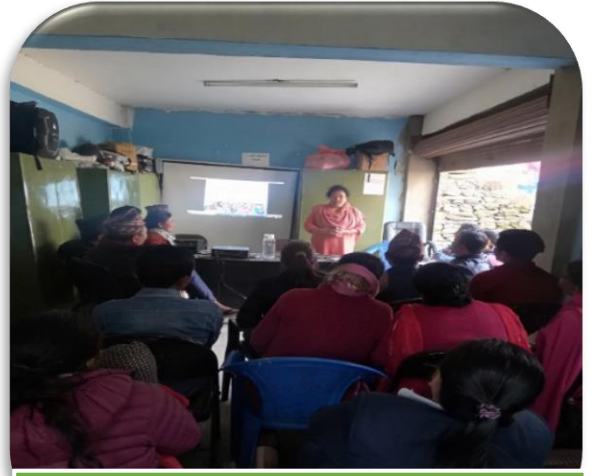
लैससास कार्यक्रममा अभिमुखिकरण कार्यशाला गोष्ठिका सहभागीहरु