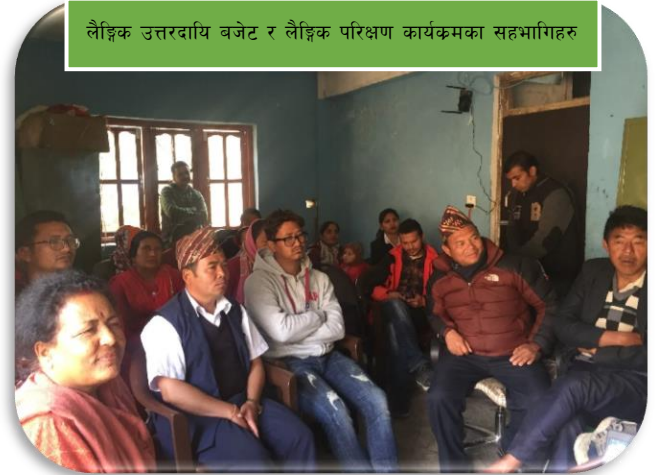
लैङ्गिक उत्तरदायि बजेट र लैङ्गिक परिक्षण कार्यक्रमका सहभागीहरु