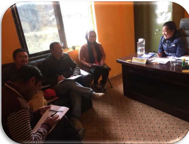
लैससास कार्यदल गा.पा. का दस्तावेज हरु माथी छलफल गर्दै